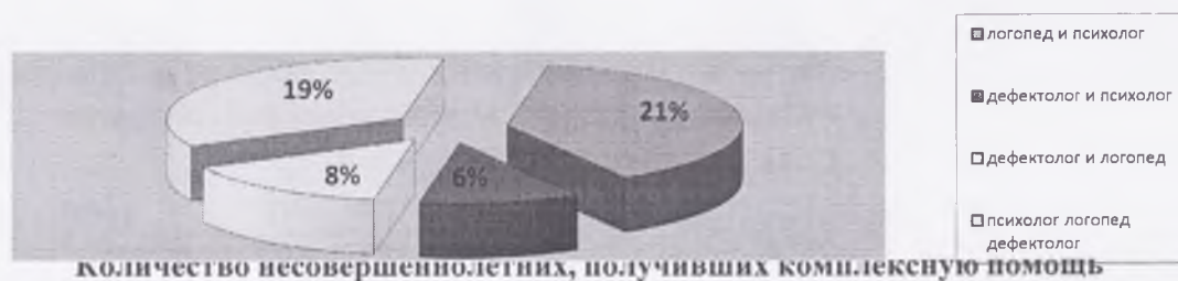
количество несовершеннолетних, получивших комплексную помощь